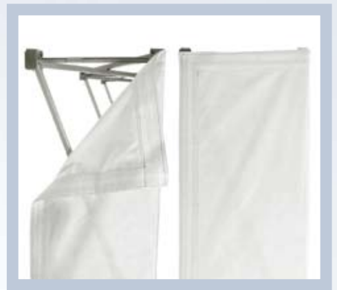
Kuva kiinnitetään kätevällä tarrakiinnityksellä. Kuva voi olla vain edessä tai sekä edessä että sivuilla.