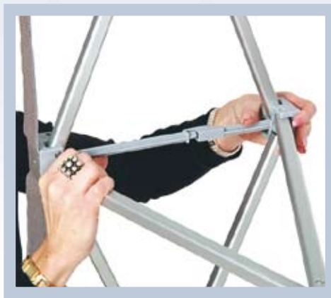
Rakenne lukitaan säppisulkimella.